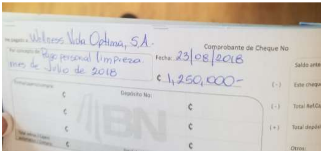
Imagen 3. Comprobante de pago.

Expedición de cheques no registrados cuyos pagos no aparecen acordados en libro de actas de Junta Directiva. Se encuentran comprobantes de cheques emitidos con fecha 23 de agosto del 2018 (ver imágenes 3, 4, 5 y 6). Estos pagos no aparecen registrados como acuerdos de la Junta Directiva, y cuya fecha es posterior a la última reunión en la que estuvo presente la denunciante, la cual fue en junio.