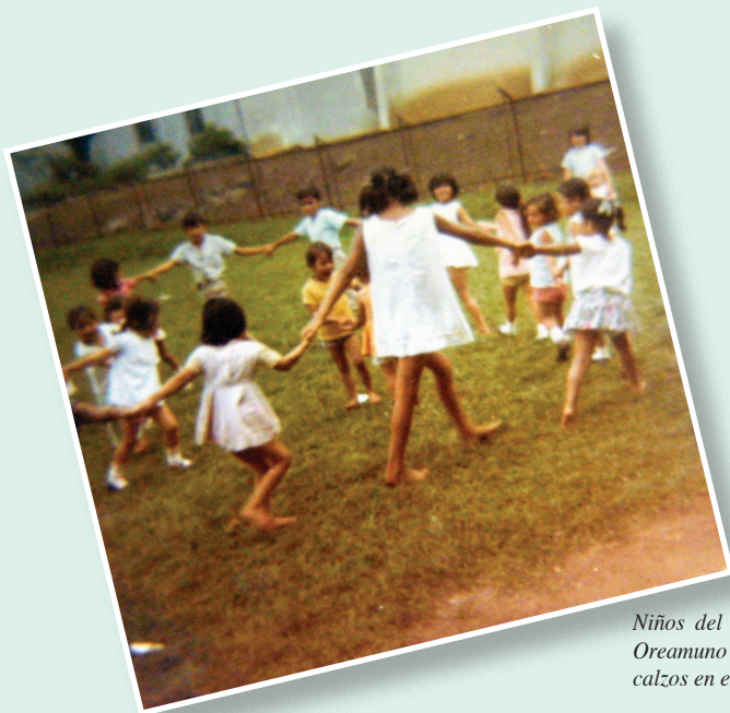
Niños del CEN de San Rafael de Oreamuno de Cartago jugando descalzos en el año de 1973.

Producto de los resultados de las encuestas, en 1950, el Ministerio de Salubridad firmó un convenio con el Fondo de las Naciones Unidas para la Infancia (UNICEF), con el fin de desarrollar un Programa de Alimentación Complementaria, a beneficio directo de los grupos más sensibles nutricionalmente de la población (niños y niñas de 0 a 7 años, madres embarazadas y madres en periodo de lactancia)