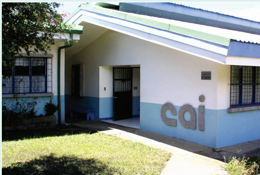
Este es el actual CINAI de Barva de Heredia, cantón donde se fundó el primer Centro de Nutrición.

En 1951 se estableció el primer Centro de Nutrición, ubicado en Barva de Heredia . Actualmente existen 617 establecimientos entre CEN-CINAI, CENCE y Puestos de Distribución, en donde se atienden a un total de 171.890 clientes y beneficiarios entre bebés, preescolares, escolares, madres embarazadas y lactantes.