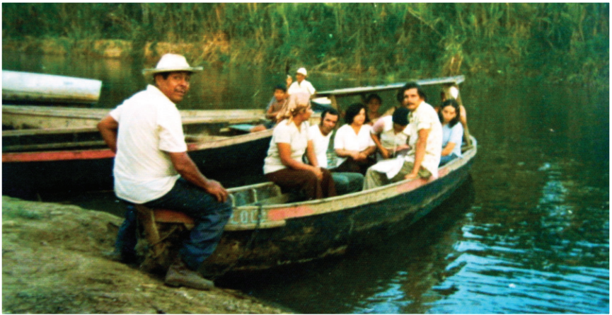
Técnicos de nutrición navegando por el Río Terraba en la Encuesta de Nutrición del año 1978.

Paralelo a ello, el Ministerio de Salud acordó en 1957, con la Cooperativa Americana de Remesas al Exterior (CARE) y más adelante con la Agencia Internacional para el Desarrollo de los Estados Unidos (USAID), la adquisición de alimentos donados por el gobierno y el pueblo de los Estados Unidos, para los escolares de Costa Rica, que también fueron distribuidos a través de los Centros de Nutrición.