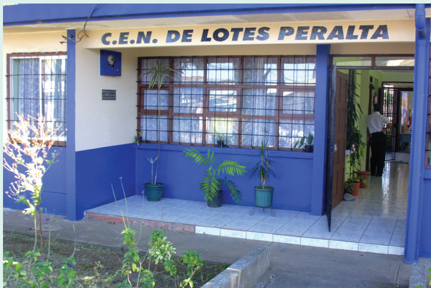
CEN de Lotes Peralta de Heredia construido según su placa por el aporte de C.A.R.E.