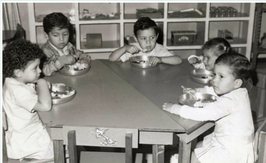
Niños comiendo en un CEN, década de los 80.

El Programa de Nutrición contó con el financiamiento total del Gobierno hasta diciembre de 1974, con la aprobación de la Ley N° 5662 de Desarrollo Social de Asignaciones Familiares. Gracias al autofinanciamiento que otorgó dicha Ley, la cobertura del Programa se amplió, de manera que en 1977, se logró atender a 31.642 beneficiarios de comidas servidas y 84.711 beneficiarios de distribución de leche.