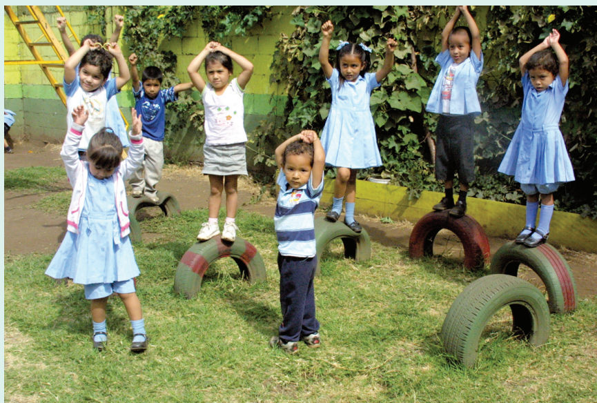
Los niños de los CEN-CINAI disfrutan en grande de las actividades al aire libre.